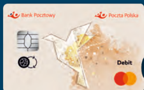
Karta z logo Poczty Polskiej

Karta wydawana w postaci fizycznej, zapewniająca wygodny dostęp do pieniędzy zgromadzonych na Twoim koncie z każdego miejsca na całym świecie.